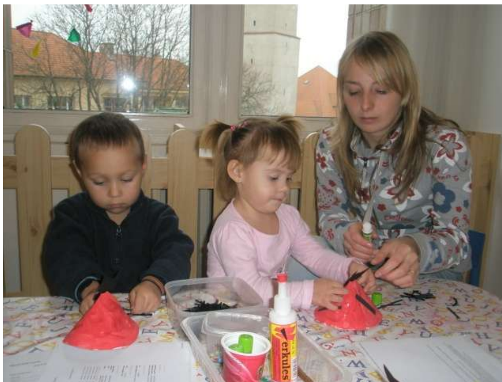
Obrázek 8 Miniškola Rolnička

Miniškola je provozována v půldenním režimu od 8-12 hod pro děti ve věku od 2 do 4 let (mladší děti po dohodě). Maximální kapacita miniškoly je čtyři děti v jednom čase na jednu pečovatelku. V zájmu kvality poskytované služby se nejedná o pouhé hlídání dětí, ale péče je zaměřená na celkový rozvoj dítěte s ohledem na jeho individuální specifika a věk, přiměřeně rozvíjí jeho rozumové a řečové schopnosti, pohybové, pracovní, hudební i výtvarné schopnosti a kulturně hygienické návyky. Je dbáno také na bezpečnost a zdraví dítěte, součástí služby je pobyt na čerstvém vzduchu.