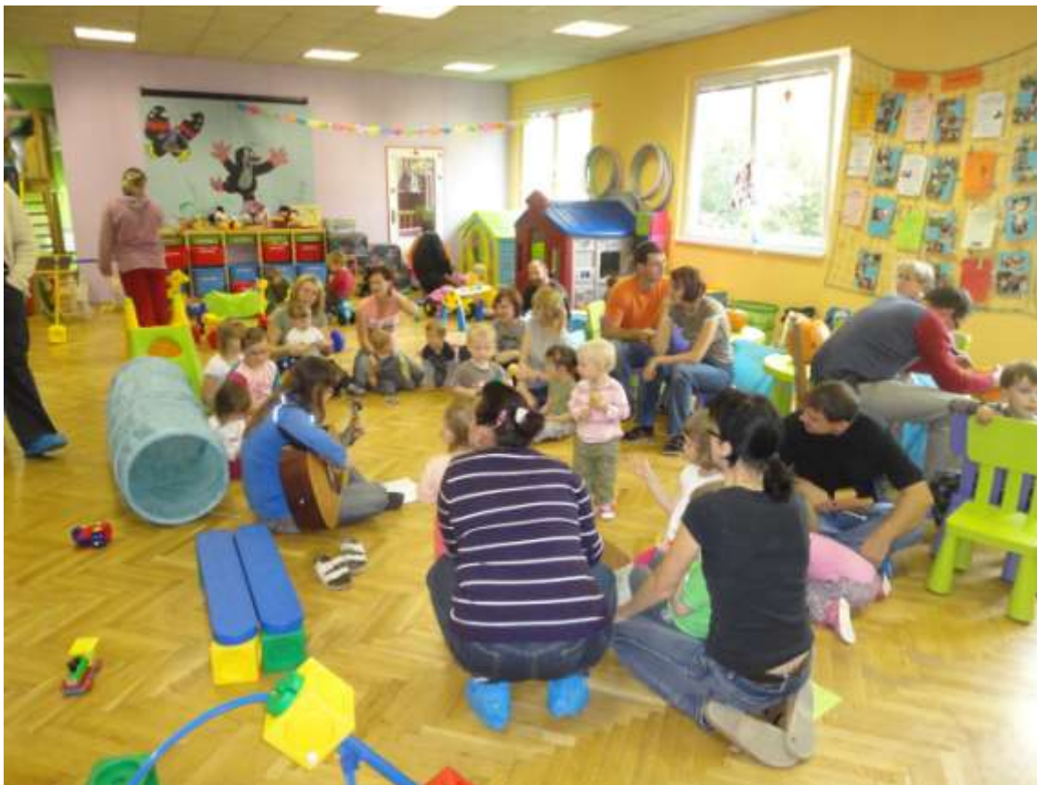
Obrázek 3 Výlet s drakem

Zavedli jsme krátkodobé hlídání dětí , a to v úřední den, v pondělí dopoledne, aby si mohly maminky celodenně pečující o malé dítě vyřídit nutné záležitosti. Tato služba se setkala s velkým ohlasem.