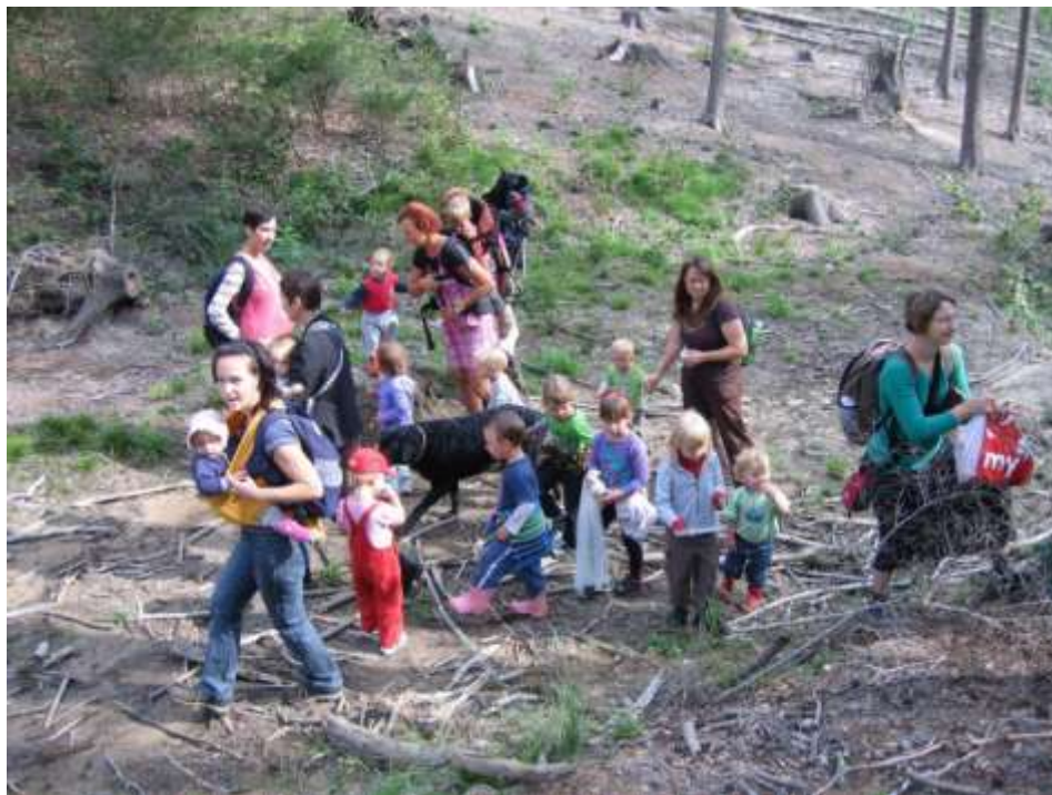
Obrázek 10 Výlet "Hledání pokladu na Kokořínsku"

Další aktivity organizujeme také v plenéru nebo v prostorách některé spolupracující organizace (např. v RC Chloumek nebo Regionálním muzeu Mělník).