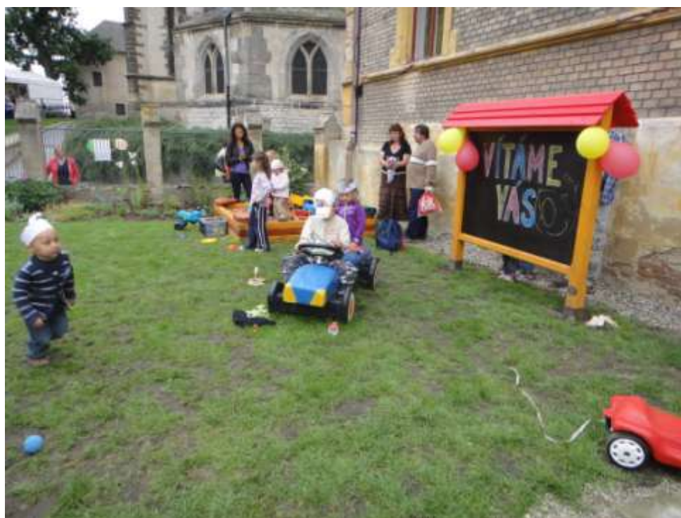
Obrázek 9 Slavnostní "Otevření zahrady veřejnosti"

V roce 2010 jsme uskutečnili dotazníkové šetření, které nám přiblížilo, co by budoucí návštěvníci rádi na zahradě využívali. V září 2010 se přímo v prostoru zahrady na plánovacím dnu sešla odborná i laická veřejnost. Se samotnými pracemi jsme začali v říjnu, kdy jsme na zahradě uklízeli, plánovali definitivní rozmístění jednotlivých prvků a jednali s odborníky i s úřady.