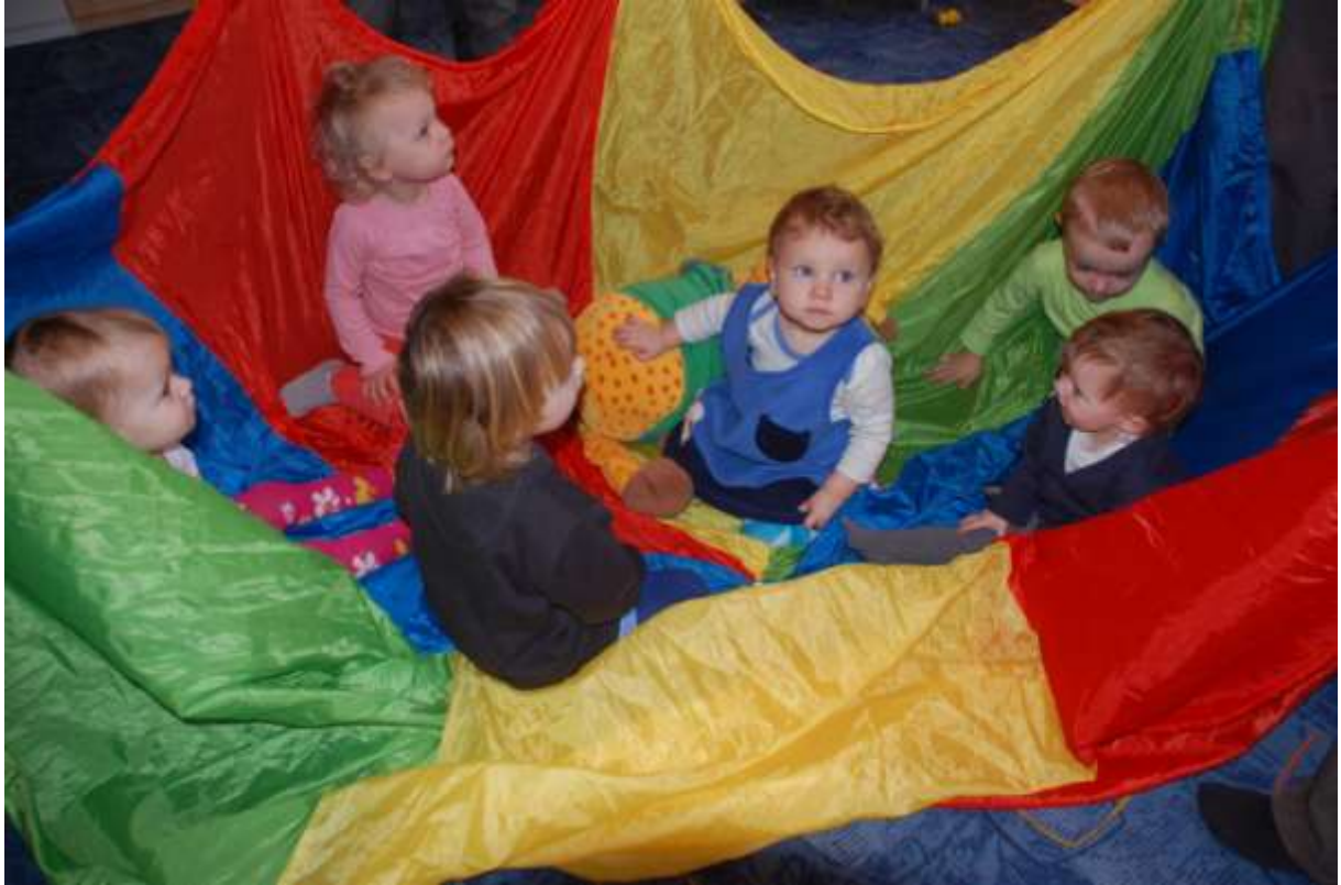
Obrázek 1 Herna " První krůčky"

Posláním našeho sdružení je posilování hodnot rodiny a mezigeneračních vztahů, úlohy rodičů, mateřské a otcovské role ve společnosti a podpora zdravého života ve zdravém prostředí.