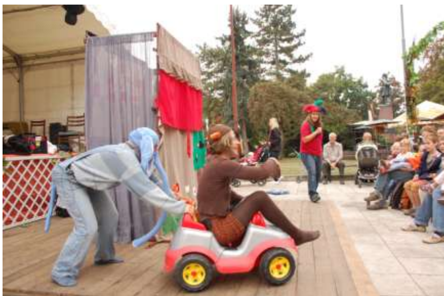
Obrázek 11 Divadlo z Kašpárkova kouzelného kufříku na Mělnickém vinobraní