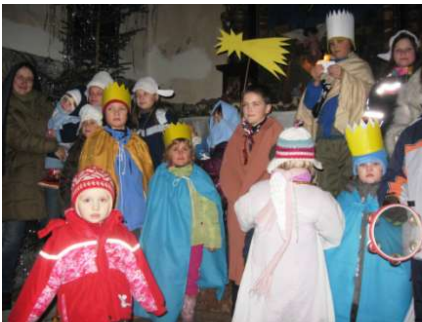
Obrázek 2 Putování se třemi králi za mělnickými betlémy

Naše rodinné centrum vytváří především přátelské zázemí , kde se mohou rodiče a jiní vychovatelé setkávat, předávat si zkušenosti, navazovat nová přátelství, učit se od sebe navzájem. Pro tato neformální setkávání jsou nejvhodnější herny (Pro děti je na hernách připraven program, který adekvátně rozvíjí jejich psychomotorické dovednosti). Děti se zde od nejútlejšího věku setkávají se svými vrstevníky a učí se pobytu v jiném než domácím prostředí, což rodiče zvláště ocení při návratu do zaměstnání, kdy se děti lehce zapojují v mateřské škole.