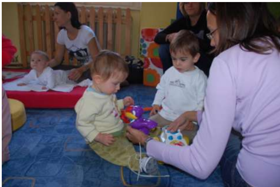
Obrázek 4 Herna " Neviňátka"

Návštěvníci Rodinného centra se mohou nejen zúčastnit, ale i aktivně pomoci s organizací akcí, nejsou v rodinném centru pouhými „konzumenty“ připraveného programu, ale jeho aktivními spoluvůrci. Také program přednášek a seminářů spoluurčují naši návštěvníci. Jejich náměty a spokojenost zjišťujeme každoročně dotazníkovým šetřením.