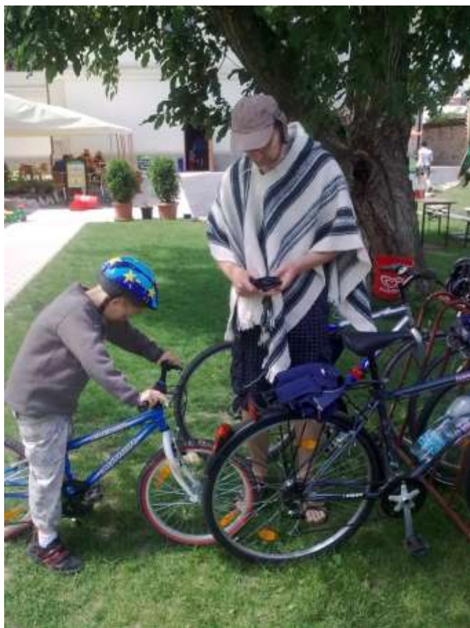
Obrázek 5 Cyklovýlet pro táty

Tým rodinného centra tak musel k běžnému provozu (zajišťování heren, přednášek, seminářů, konzultací, půjčování monitorů dechu a jiných pomůcek, knihovny, akcí pro celé rodiny, kroužků a cvičení pro děti i dospělé, hlídání dětí etc.) zvládnout i náročnou a vysoce odbornou činnost např. při přípravě rekolaudace a úpravě prostor pro miniškolku, při sestavování osnov pro miniškolku nebo při řešení rekultivace a architektonické úpravy proboštské zahrady. Samozřejmě nesmíme zapomínat, že i další práce skrytá v pozadí (účtování a mzdová agenda, práce fundraisera apod.) se s oběma projekty znásobila a začala klást na tým rodinného centra ještě vyšší nároky.