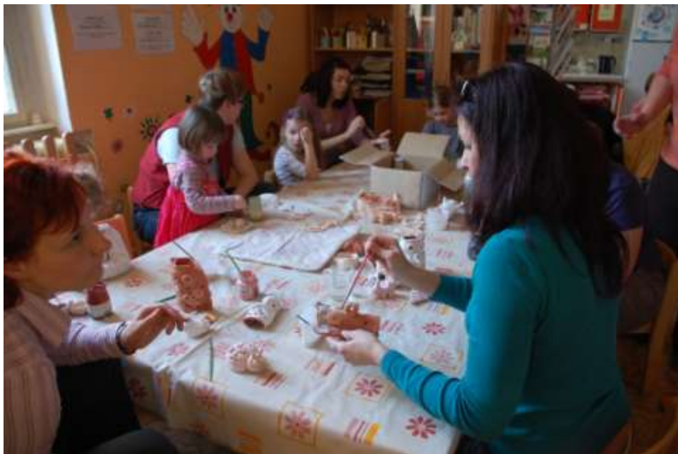
Obrázek 7 Tvoření s keramikou

I v průběhu roku 2011, každý druhý čtvrtek v měsíci, probíhaly individuální konzultace se zkušenými personalistkami z projektu Krok k zaměstnání (poradenství při hledání zaměstnání) ve Středočeském kraji. Poradenství bylo určeno rodičům dětí ve věku do 15 let, především maminkám plánujícím návrat do zaměstnání po rodičovské dovolené, a bylo poskytováno bezplatně. Během konzultace bylo zajištěno hlídání dětí.