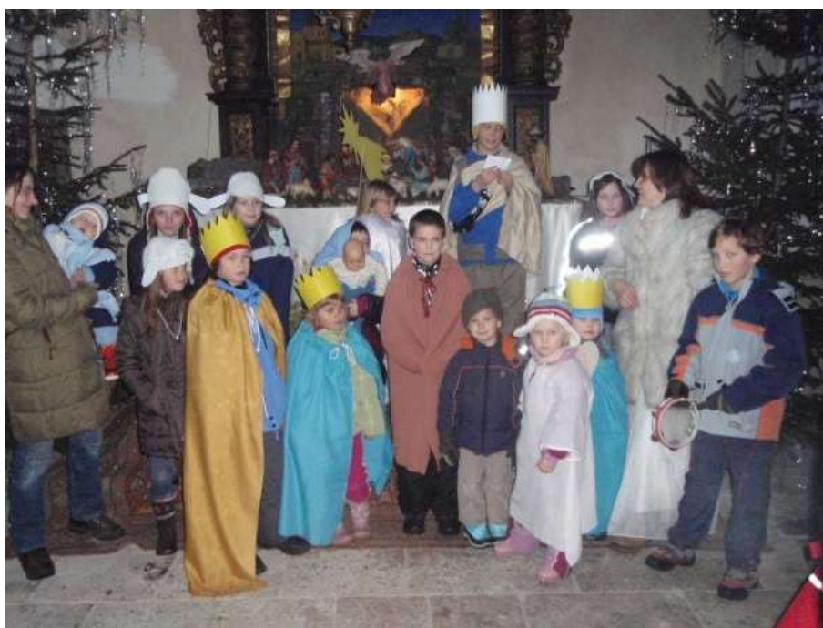
Obrázek 2: Betlémy