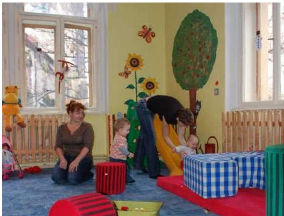
Obrázek 6: Herna

Novinkou, kterou v rodinném centru organizují muži, jsou tzv. Fotroviny, sobotní odpolední herna pro všechny hravé otce a táty. Od listopadu vždy třetí sobotu v měsíci.