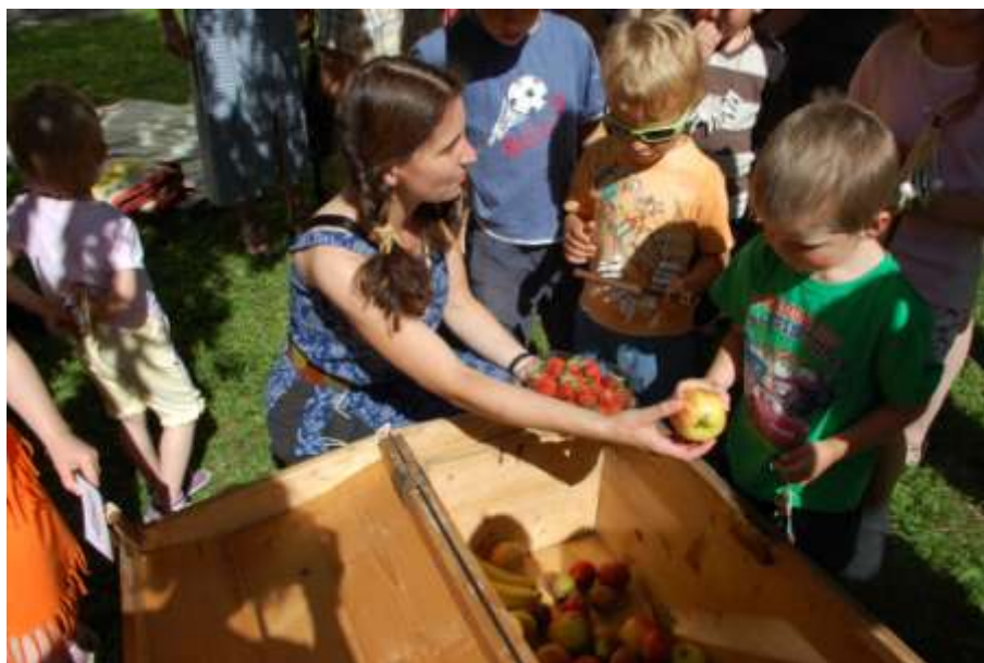
Obrázek 11: Hurá prázdniny