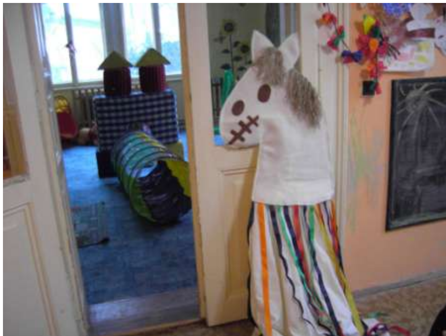
Obrázek 3: Masopust