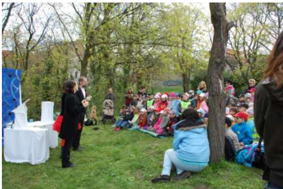
Obrázek 10: Den Země

Doufáme ale především, že nás i v roce 2011 bude provázet přízeň našich návštěvníků, že jich bude i nadále přibývat, a že na ten čas, který v Kašpárku společně strávíme, budeme i po letech s potěšením vzpomínat.