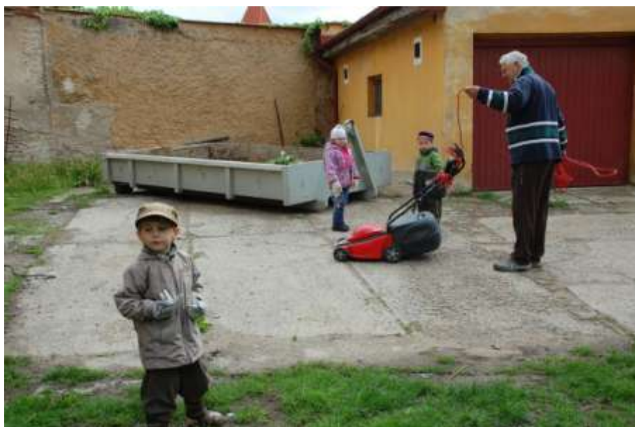
Obrázek 8: Úklid zahrady

Chtěli bychom prohloubit spolupráci s Azylovým domem Mělník, kde jsou ubytovány rodiny s dětmi. Plánujeme několik společných akcí, mj. pravidelné Muzicírování.