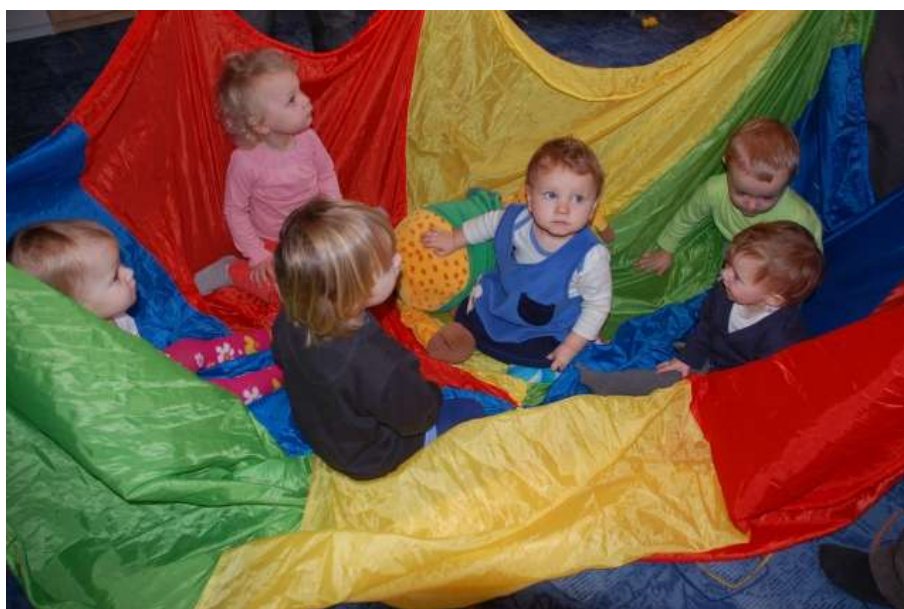
Obrázek 7: Herna

Na zájmové kroužky omezuje počet na 12 účastníků - při více účastnících bychom nemohli zaručit individuální přístup lektora. Počet dospělých účastníků kurzů, které obsahují cvičení, je z prostorových důvodů omezen na 8 osob.