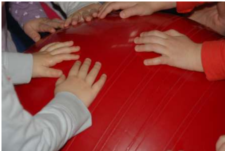
Obrázek 1: Herna

Posláním našeho sdružení je posilování hodnot rodiny a mezigeneračních vztahů, úlohy rodičů, mateřské a otcovské role ve společnosti a podpora zdravého života ve zdravém prostředí.