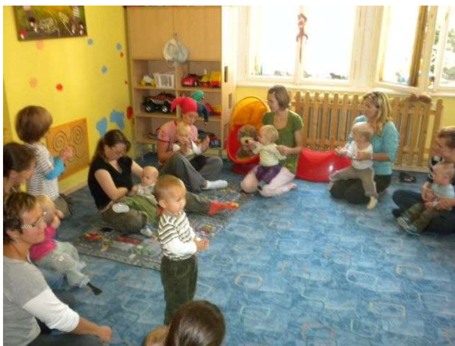
Obrázek 12: Herna