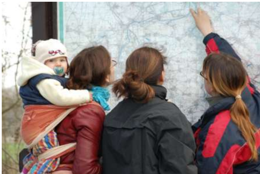
Obrázek 9: Výlet

A v neposlední řadě nás čeká práce na personální stabilizaci a větší profesionalizaci organizace.