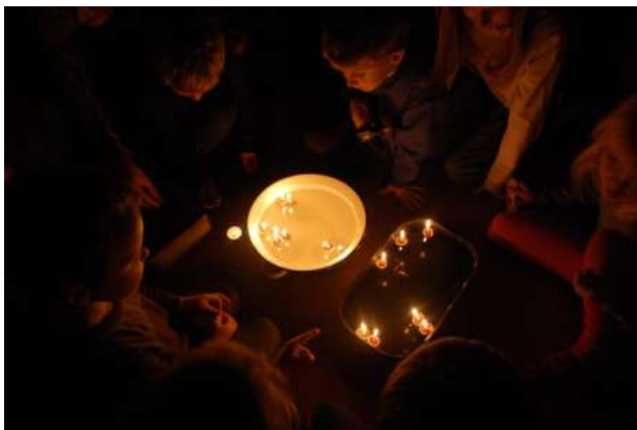
Obrázek 5: Vánoce v Kašpárku

Během roku jsme se samozřejmě snažili zušlechtit a lépe vybavit prostory rodinného centra. K přístrojovému vybavení přibily nový počítač, tiskárna a projektor. Díky finanční podpoře Města Mělník jsme mohli v prosinci nakoupit materiál na rekonstrukci koupelny. a v neposlední řadě jsme nakoupili nové hračky do hery, což naši nejmenší návštěvníci při oslavě Vánoc v Kašpárku ocenili nezapomenutelným způsobem.