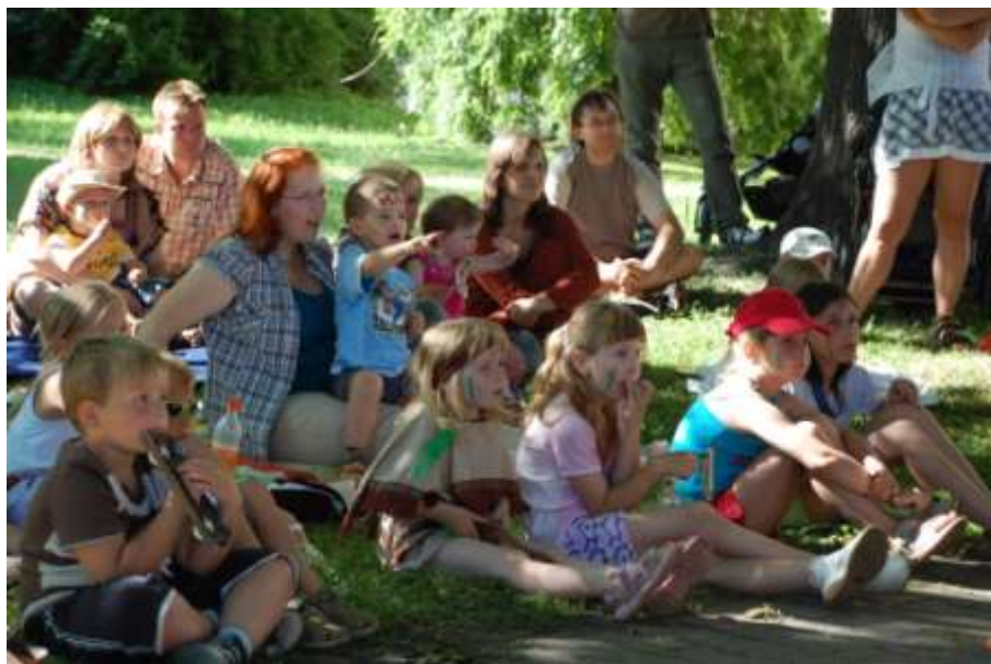
Obrázek 4: Hurá prázdniny v indiánském

a krásná Indiánská pohádka Divadélka Romaneto. Tato akce byla podpořena Odborem kultury a školství města Mělník.